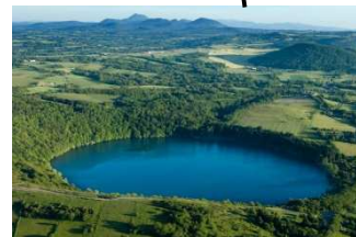
Gour de Tazenat