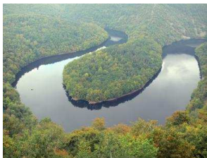
Méandre de Queuille