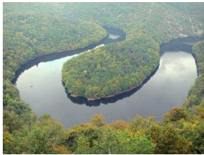
Méandre de Queuille