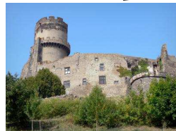
Château Tounoël (Volvic)