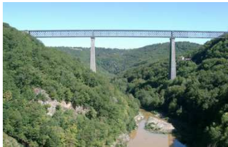
Les Fades, Barrage et Viaduc